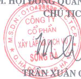
TRẦN XUÂN CHÍNH